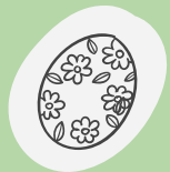
das Osterküken -kurczak wielkanocny