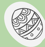
den Tisch schmucken - ozdabiać stół