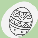
der Frühling – wiosna