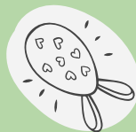
das Osterlamm - baranek wielkanocny