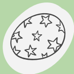
die Süßigkeiten - słodczyce