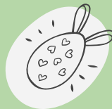
Ostereier bemalen – malować pisanki