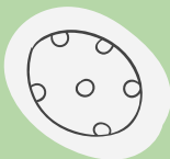
der Marmorkuchen – babka marmurkowa